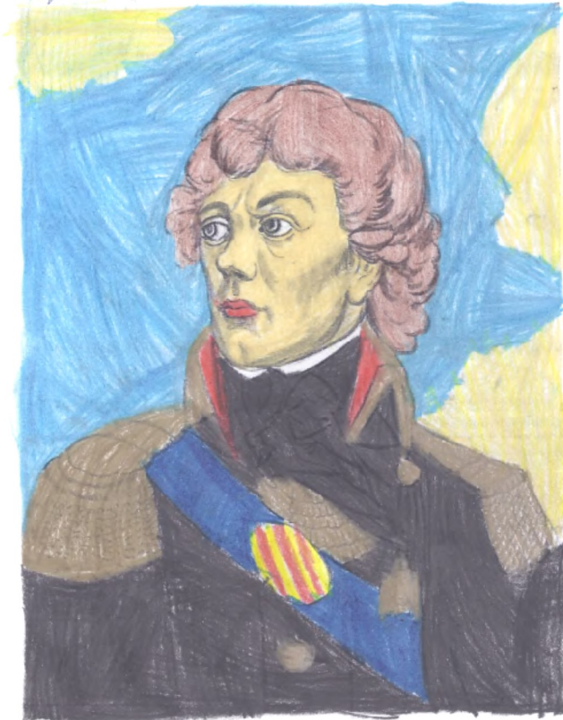
TADEUSZ KOŚCIUSZKO – PATRON NASZEJ SZKOŁY