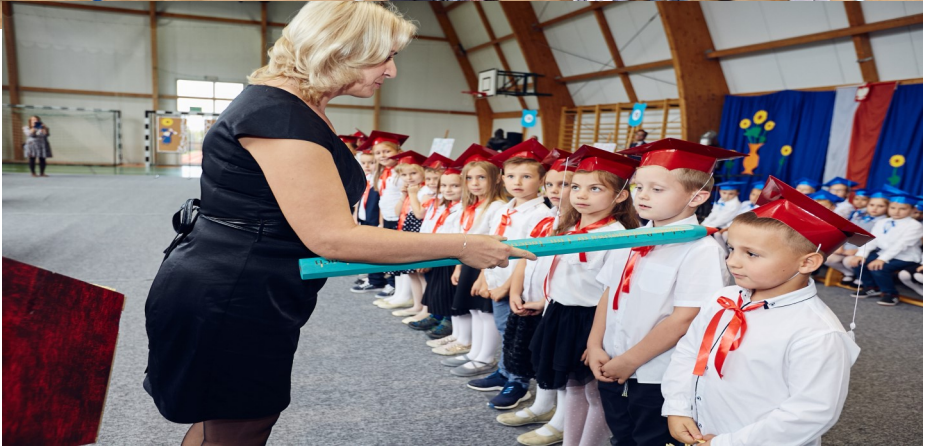
1. Wycieczka do Interaktywnego Centrum Pszczelarstwa Apilandia, 2. Akcja „Odblaskowa Szkoła”, 3. Ślubowanie uczniów klas I.